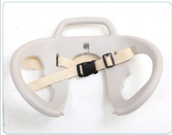
3. Rögzítse a szíjat a háttámlához