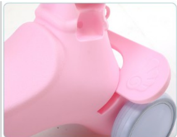
2. Rögzítse a lábtartót