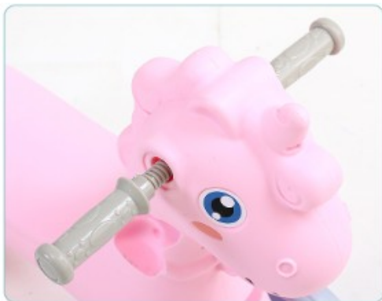
1. Rögzítse a markolatokat