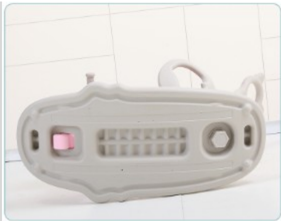
6. Csavarja be az alsó oldalon található csavarokat.