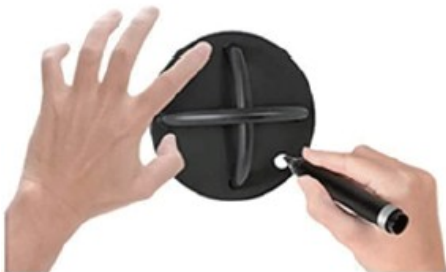
1. Jelölje be a pozíciókat