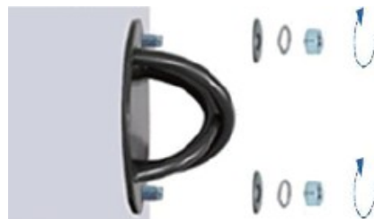
4. Húzza meg a csavarokat