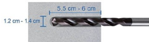
2. Fúrjon lyukat a stabil, szilárd mennyezetbe