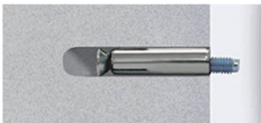
3. Tisztítsa meg a furatot és helyezze be a csavart