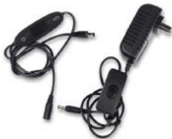
Tápkábel és vezérlő