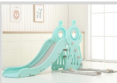
7. Csatlakoztassa az alapot a hintához