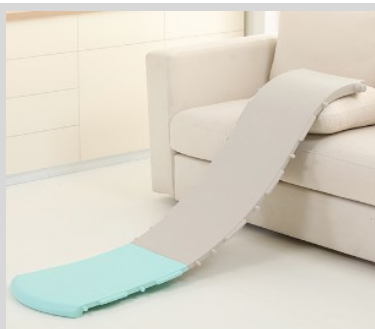
1. Csatlakoztassa a csúszda két részét