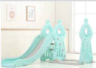
8. Csatlakoztassa a harmadik támasztó panelt