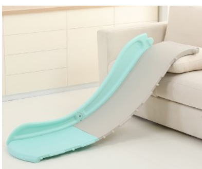
2. Csatlakoztassa az oldalsó panelt