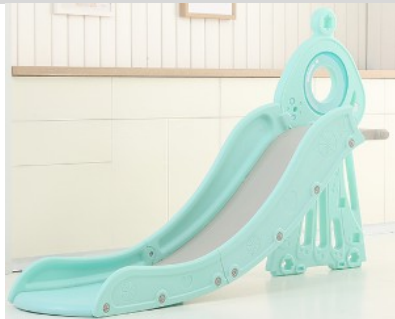
4. Csatlakoztassa a támasztó váz felét