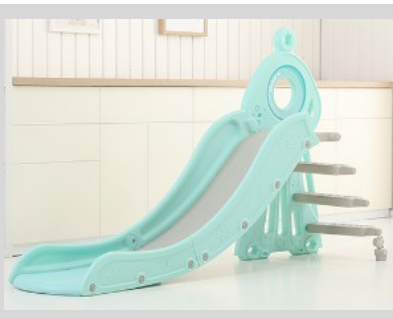
5. Rögzítse a lépcsőket