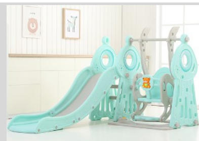
9. Rögzítse a csúszdát