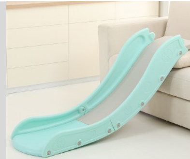
3. Csatlakoztassa a másik oldalt