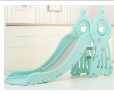
6. Rögzítse a váz másik felét